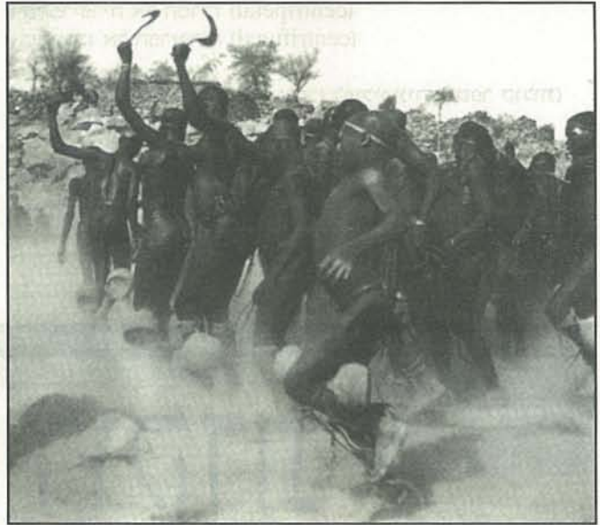
מתוך "THE DANCES OF AFRICA", צילום: מישל הואה

בשנה שעברה ראה אור ספר צילומים של מישל הואה (Michel Huet) עם טקסטים מאת קלוד סברי (Claude Savary), הנקרא פשוט "ריקודי אפריקה" (The Dances of Africa), הוצאת אברמס, ניו יורק), שכל חובב ריקוד וצילום יהנה ממנו. הספר מחולק לפי האזורים הגיאוגרפיים שבהם ביקר הצלם בשנות נדודיו הארוכות ביבשת. בעיקר מיוצגות הארצות דוברות הצרפתית, מושבותיה לשעבר של צרפת (דומני, שאין עוד מעצמה קולוניאלית שתרבותה כל כך שזורה בחיי נתיניה לשעבר כמו צרפת, גם היום שנים אחרי שזכו מושבותיה לשעבר בעצמאותן).