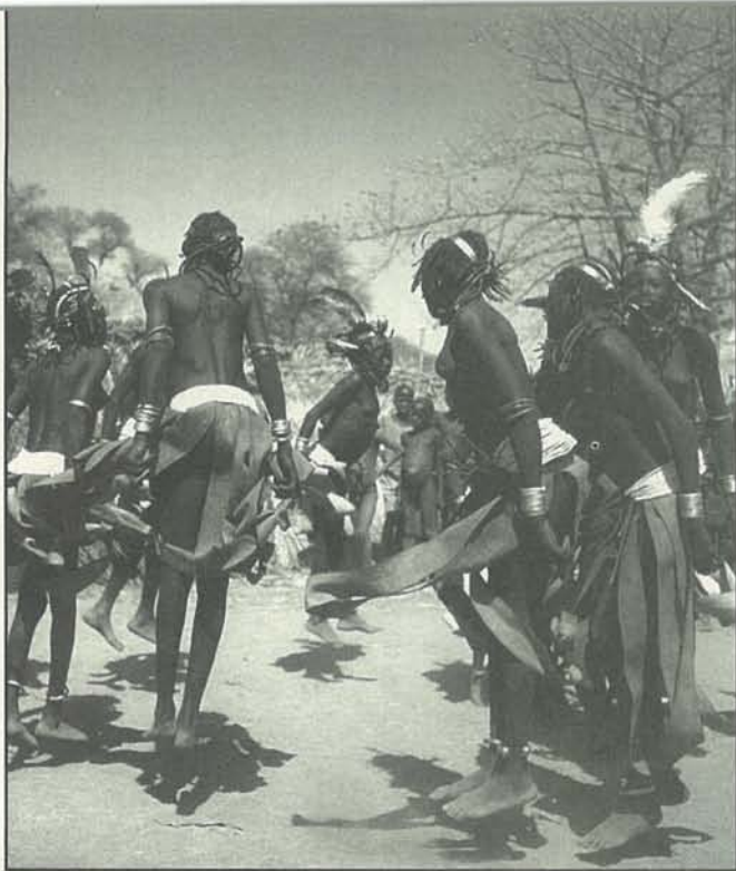
מתוך "THE DANCES OF AFRICA"

הספר מצטיין בצילומי מחול מלאי תנועה שאינם דומים ל"פוזות" הקפואות של תצלומים ישנים. התנופה האדירה של המחול האפריקאי ניכרת בכל עמוד ועמוד.